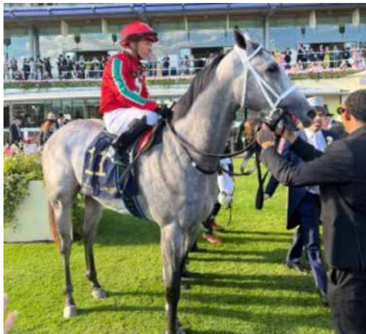
GABALDON se lució en Royal Ascot.

BOUDICA y OBAYATE cierran las clasificatorias para las Breeders' Cup 2024 en Latinoamérica. LIMA, Perú (23 de Junio, 2024) – La potranca de 3 años del Stud Paracas, Boudica (PER), superó a la favorita Alexandrina (PER) en la mitad de la recta final para ganar el Gran Premio Pamplona (G1) el 23 de Junio por 1 cuerpo sobre Macanuda en el Hipódromo de Monterrico en Perú. La ganadora recibirá una posición de salida automática y los honorarios pagados en la Maker's Mark Breeders' Cup Filly & Mare Turf (G1) de 2 millones de dólares a través de la Breeders' Cup Challenge Series: Win and You're In. La Breeders' Cup Challenge Series es una serie internacional de 82 selectivas de grado en 12 países,