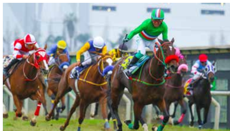
BOUDICA se impone en el Gran Premio Pamplona en Lima.