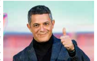
Alejandro Sanz apoya a María Corina Machado

A pocos días de las elecciones presidenciales en Venezuela, el artista español Alejandro Sanz le mostró su apoyo a la líder opositora María Corina Machado. "Hay nombres que son llaves capaces de abrir las puertas de un futuro esperanzador" escribió el cantante en su cuenta X mostrando una vez más su cariño por los venezolanos, que cabe destacar, Venezuela era el país predilecto para que los artistas de talla Internacional tuvieran una carrera consolidada. María Corina Machado aprovechó la ocasión y agradeció las palabras del artista, que son un respaldo a la labor que realiza y "una palanca potente para que el mundo nos escuche y actúe" escribió también en su cuenta de X.