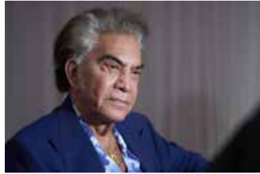
José Luis Rodríguez sale de Top Chef VIP

José Luis Rodríguez "El Puma", fue eliminado de la competencia "Top Chef VIP" a pesar de ser uno de los más queridos de esta temporada, sus dotes culinarios no le permitieron llegar a la final, sin embargo, su despedida fue por la puerta grande y rodeado de sus compañeros mientras cantaban el famoso tema del cantante venezolano "Agárrense de de las manos". El Puma sin duda era la estrella de esta temporada del reality de Telemundo, pero así como era la estrella, es evidente que este tipo de formatos no son para artistas de la calidad de José Luis Rodríguez, que buscan el show a través de controversias, por eso, su salida fue entre una disputa contra Alicia Machado, quien generó odio y críticas por su comportamiento contra el famoso venezolano. Cabe destacar, que El Puma también es culpable por aceptar firmar con este tipo de programas y asumió las consecuencias. Alicia Machado sí está acostumbrada a estos formatos, y por eso genera noticia desde lo negativo, sin embargo, en esta ocasión perdió todo y su comportamiento con El Puma dejó mucho que desear. En definitiva, a veces perdiendo se gana y ganando se pierde, por como ocurrieron las cosas, Alicia Machado fue la perdedora de este reality.