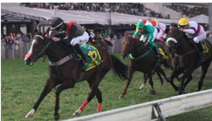
OBATAYE con Joao Moreira gana en el Gran Premio de Brasil.

Recuerden mantenerse al día con el acontecer hípico a través de nuestra web hipismo.net y en Twitter: @HipismoNet y @JCFeijoo.