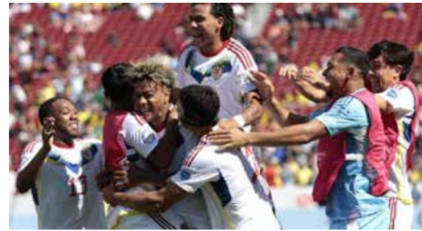
La tropa criolla espera llegar lejos