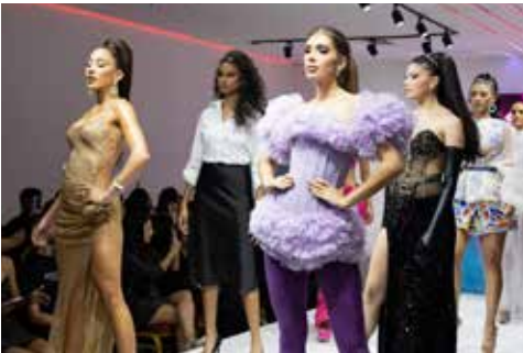
El Miss Grand Venezuela 2024